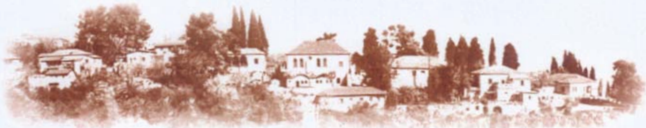
אתר לאומי "מושבת הראשונים"