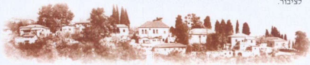
אתר לאומי "מושבת הראשונים"

אהרון: יש לטפל בנושא דירות האירוח ברחל ביתך הקטנה. צריך להיות ברור שוילות אירוח שפועלות כאשר בעל הבית לא גר בבית לא יכולות להתקיים בישוב. הוילות יוצרות מטרדי רעש ועשן לשכנים מדובר בסבל עצום לציבור.