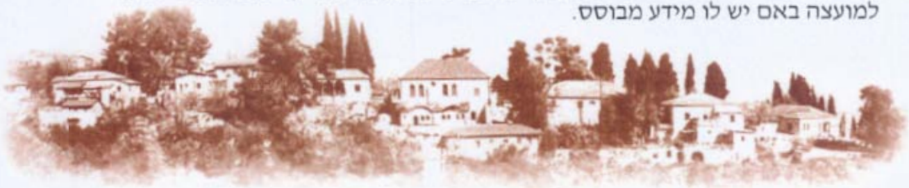
אתר לאומי "מושב הראשונים"