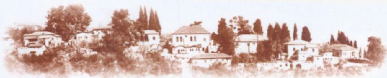
אתר לאומי "מושבת הראשונים"