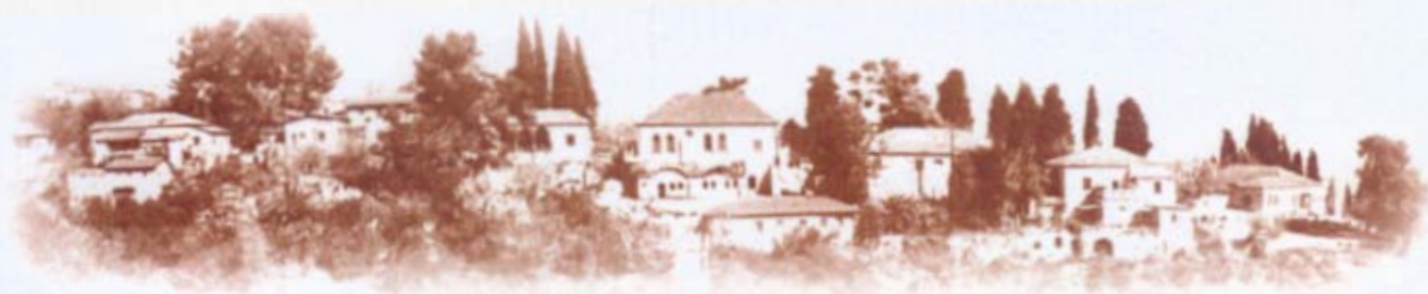
אתר לאומי "מושבת הראשונים"