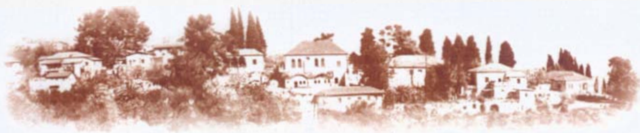
אתר לאומי "מושב הראשונים"