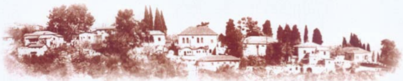
אתר לאומי "מושבת הראשונים"

היו"ר אביהוד : לא ניתן לדרוש 80% החלטת המנהל הינה 50% לתושבי המקום ו 50% לתושבי חוץ.