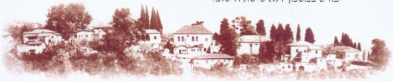
אתר לאומי "מושבת הראשונים"