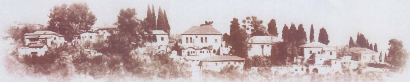
אתר לאומי "מושב הראשונים"

אישור התב"ר מותנה בקבלת התחייבות חשבית ממשרד התיירות והעברת סכום של 3 מלש"ח מארגון א.מ.י.ר.