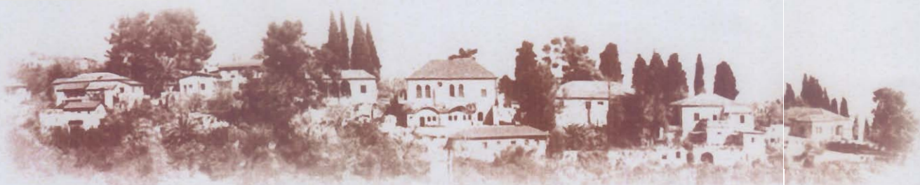
אתר לאומי "מושב הראשונים"

ראש פינה רשאית לעשות חכירת משנה למוסד שהוא מוסד ציבורי א.מ.י.ר עונה להגדרה זו.