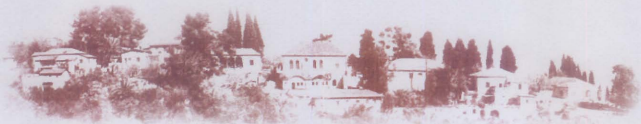
אתר לאומי "מושבת הראשונים"